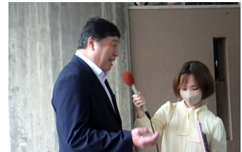
「FMえどがわ」インタビュー