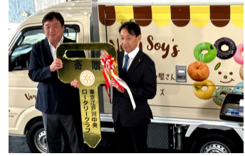
レプリカキーの贈呈