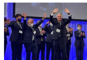
クラブ・新入会員紹介

於: グランドプリンスホテル新高輪・Zoom ホスト: 東京新都心ロータリークラブ